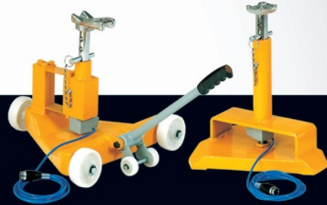
Ölçüm Sehpaları / Pick-up Units